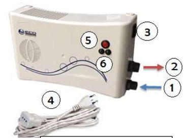
Imagen conexión a lavadora y kit